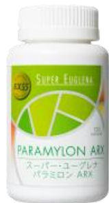
スーパー・ユーグレナ パラミロンARX

パラミロン含有率55%以上のミドリムシを認定する「ユーグレナグラシリスEX55」マークを取得しているのは、現在、ナチュラルプラスのみです。