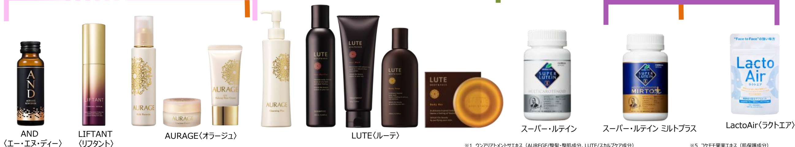
AND 〈エー・エヌ・ディー〉