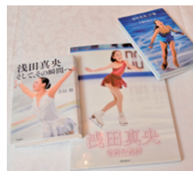
「真央ちゃんの本や写真集は全てそろえています。気分が落ち込んだときには本を読んだり写真集を見ると力が湧いてきます」