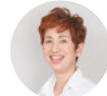
中野佐和子先生 (料理家)

「どこにでもある食材で、おしゃれ心のある料理」をテーマに、さまざまなスタイルでレシピを発信中