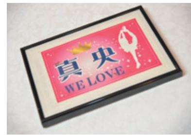
試合を応援するときに掲げる旗をファンクラブで作し、これはそのミニチュア版。ステッカーになっています。