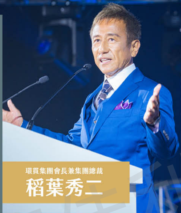
環貫集團會長兼集團總裁 稻葉秀二

環貫集團的事業體在全球橫跨20大領域，共有70家企業，Naturally Plus是其中的一員，也是環貫集團會長兼集團總裁稻葉秀二最重視的健康促進事業，他將此事業定義為「社交直消（直接消費）」，是共創資本主義具體化的事業模式，藉此超越國界把人與人串連在一起，進而引導全球邁向健康，解決健康、財富、社會問題，促使世界和平的到來。他特地在百忙之中撥空參與FESTA 2025「ZERO~進化的起點」世界年會，和所有的伙伴一起打造全球最值得驕傲的組織。