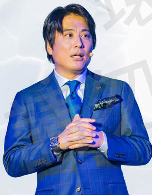
日本.綠加利社長兼美國.綠加利CEO

Naturally Plus於10月18日在橫濱太平洋會展中心舉辦年度最大規模的FESTA世界年會，今年的主題是「ZERO~進化的起點」，共有來自8個國家5,487人到場共襄盛舉。攜手全球的伙伴走過1/4世紀，Naturally Plus透過整合個人價值、團隊價值及企業價值，以共同目標意識凝聚力量，進而締造無數佳績，寫下許多的奇蹟故事。面對新世界，將跳脫過去的經驗與常識，採用全新思維，從零開始，和大家再次進化，把Naturally Plus打造成世界第一的驕傲組織。