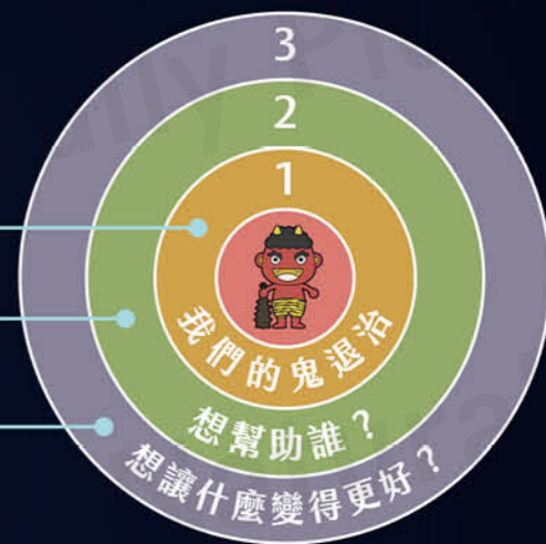
以大義與利他精神連結的組織

當你明白自己是為了分享企業、組織或團隊的志向，共創價值，這樣的目的將成為你與你組織的核心政策，當兩者的目的形成一條直線互相連結時，共創的力量會達到極大化。當目標明確後接續可透過下圖，執行PMVVC貫徹始終法則，藉此與組織、公司同頻共振，共創成功的無限可能。